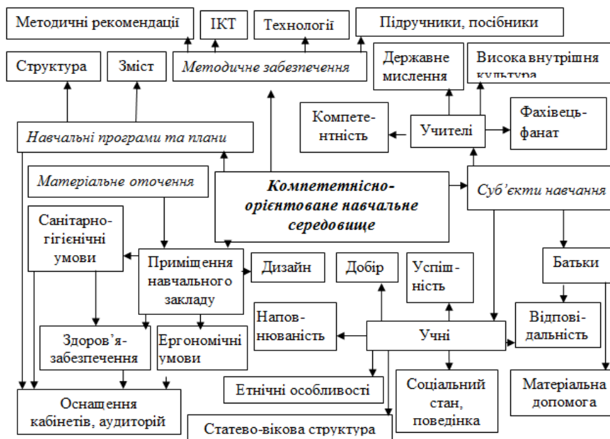
Рис. 1. Компетентнісно-орієнтоване навчальне середовище

Проаналізовано еколого-особистісну, комунікативно-орієнтовану, антрополого-психологічну, психодидактичну, екопсихологічну структуру моделі навчальних середовищ і сформовано компетентнісно орієнтоване навчальне середовище, рис. 1.