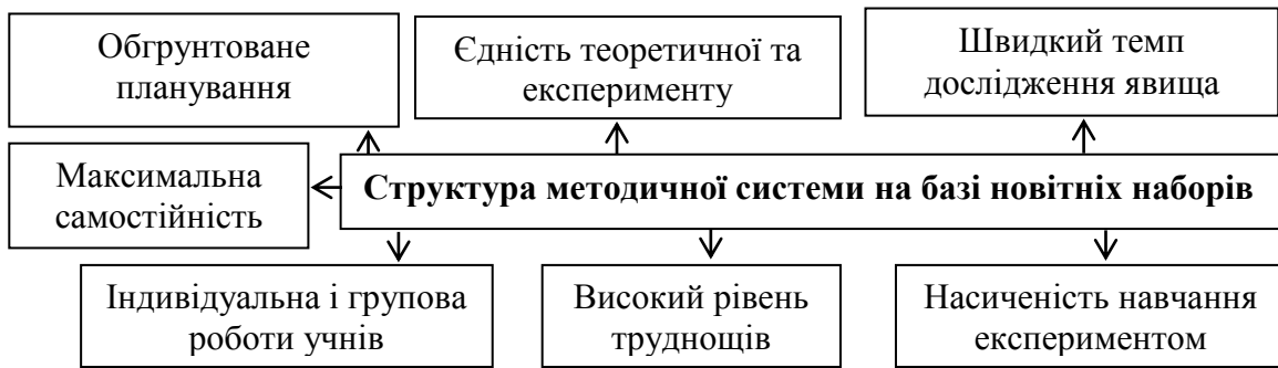
Рис. 2. Модель методичної системи навчання фізики

Здійснено аналіз еволюції навчального обладнання та організації ШФЕ, в зв'язку з запровадженням компетентного підходу навчання та розробленням новітніх наборів приладів та обладнання з фізики, визначили педагогічні та методичні умови, за якими визначається ефективність новітнього обладнання.